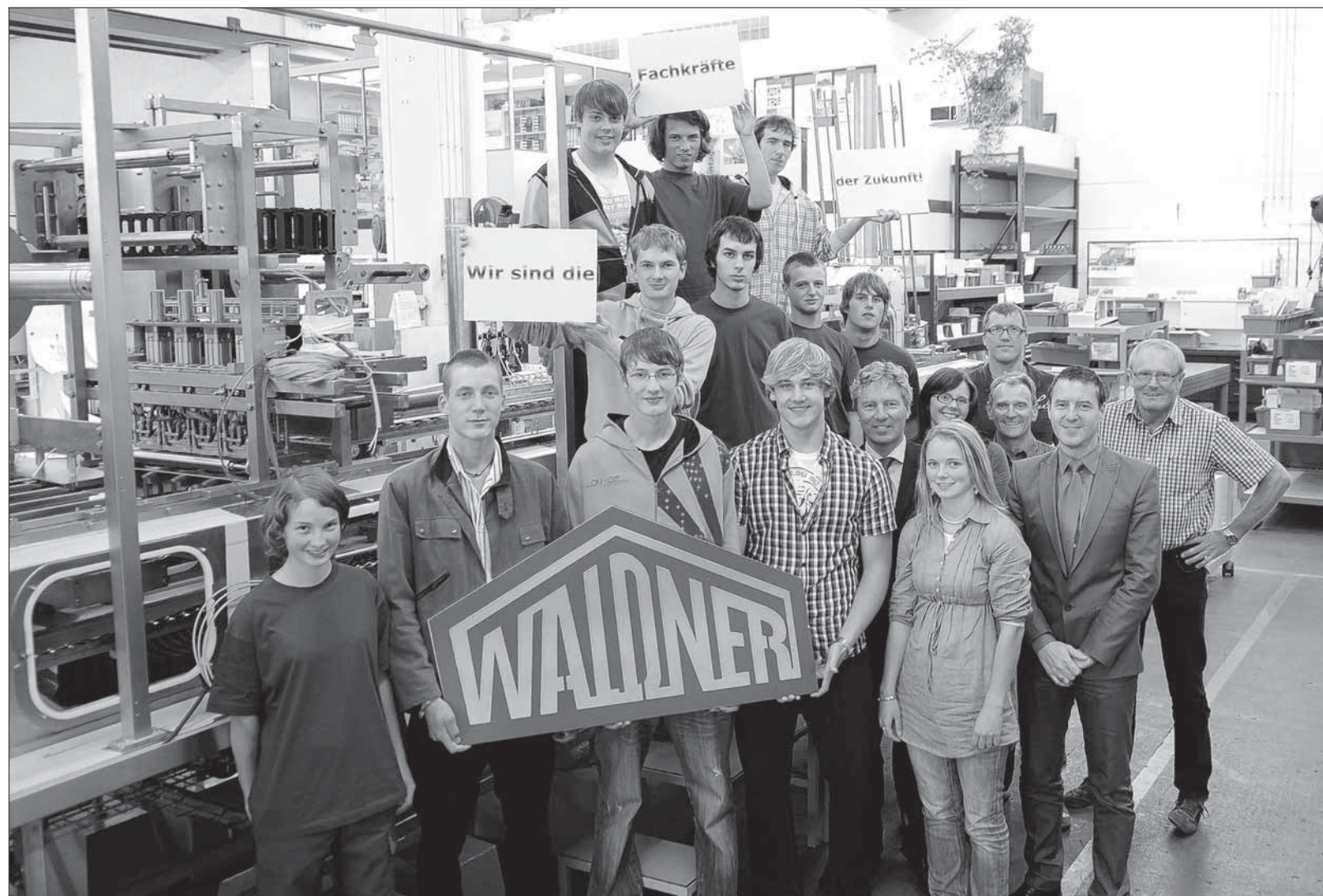
„Wir sind die Facharbeiter der Zukunft.“ – die 14 neuen Azubis der Firmengruppe Waldner in Wangen.